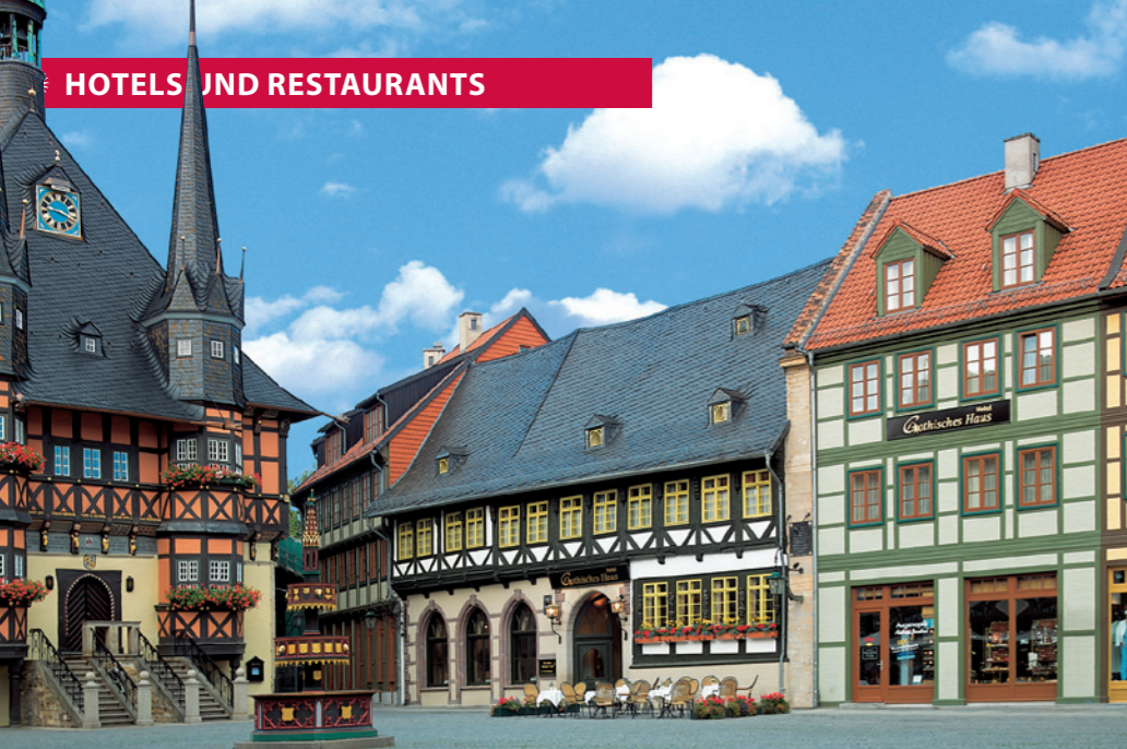
Wohnen in einem Schmuckstück: Das Hotel Travel Charme Gothisches Haus ist eines der ältesten und schönsten Fachwerkbauwerke und traditionsreichsten Gasthäuser von Wernigerode.