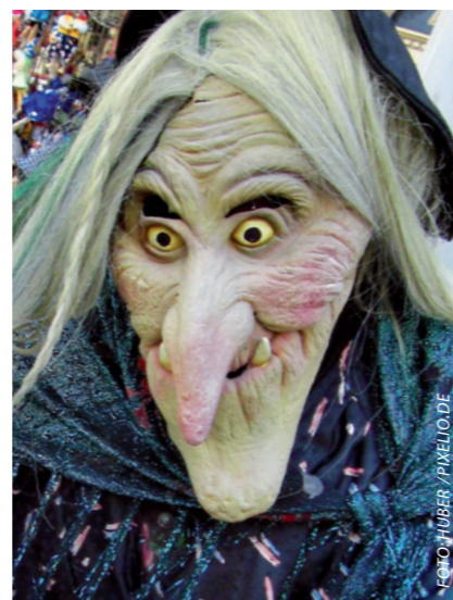
Tanzende Hexen gibt es im Harz in der Walpurgisnacht auf und um den Brocken.

Auch das Gothische Haus verfügt über eine lange Tradition und Geschichte. Nach dem Rathaus ist es das historisch bedeutsamste Gebäude am Marktplatz von Wernigerode. Das heute noch erhaltene Haus wurde bereits in der zweiten Hälfte des 15. Jahrhunderts erbaut. Beim Eintreten in das historische Gebäude erleben Besucher dann aber gerade deshalb eine Überraschung: Hinter der historischen Fassade verbinden sich jahrhundertealte Tradition und der moderne Komfort eines 4-Sterne-Superior-Hotels auf harmonische Art und Weise. Man entdeckt historische Details, wie zum Beispiel die seit dem 15. Jahrhundert erhaltene Brandmauer, von der es überall im Haus Teile zu entdecken gibt, die mit