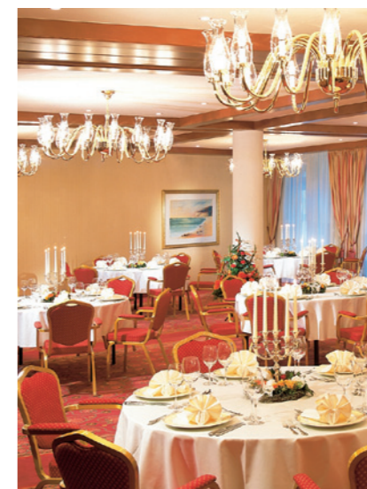
Königlich lässt es sich in einem der zahlreichen Säle des Hauses feiern.

Gothischen Haus stattfinden – oder wo auch immer es dem Paar gefällt. Denn: Für das Hochzeitsfest stehen fünf großzügige lichtdurchflutete, klimatisierte und teilweise auch kombinierte Räume zur Verfügung. Von 23 bis 175 Quadratmetern kann Platz für jede Gesellschaft jeder Größe und Vorliebe geboten werden. Der „Winkeller 1360“, ein historisches Kellergewölbe mit rustikalem Flair, kann zum Beispiel als Location exklusiv gebucht werden. Ansonsten sind bei der Gestaltung der Feierlichkeiten auch wenig Grenzen gesetzt. Büffet oder Menü, Kaffeetrinken oder Candle-Light-Dinner, Gourmet-Dinner im kleinen Kreis oder gleich die ganz große Feier – möglich gemacht werden kann im Travel Charme Gothische Haus so gut wie alles. Das Paar muss nur wissen, was es will. Und weiß es das nicht, stehen erfahrene Mitarbeiter zur Beratung zur Verfügung.