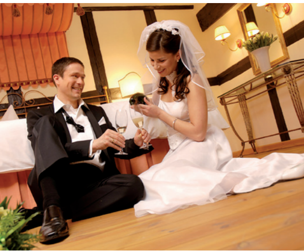
In der Hochzeitssuite kann man nach der Feier noch einmal zu zweit anstoßen und die Liebe genießen.