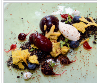
V.o.n.u.: Spargelsülze mit Linsen, lauwarmer Lachsforelle mit Gurke und Ingwer, Gebrillter Kürbis mit Steinpilzen und Petersilienwurzel, Kalb mit Steinpilzen und Bohnen, Tanne, Brombeere und Schokolade.