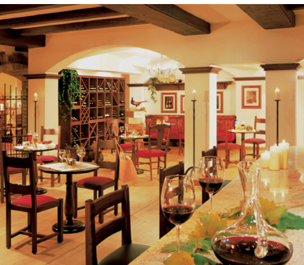
Der „Winkeller 1360“, ein historisches Kellergewölbe mit rustikalem Flair, kann als Location exklusiv gebucht werden.

Einfälle den gewissen Kick. Weshalb er sich auch eigentlich nicht sorgen muss, ob seine Menüs den Hochzeitspaaren in Erinnerung bleiben.