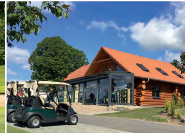
Seit kurzem steht die neue Rezeption für Hotel und Golfclub sowie eine neue gemütliche Bar zur Verfügung.