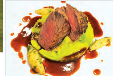
Das erweiterte kulinarische Angebot konzentriert sich vorwiegend auf saisonale Zutaten aus der Region.